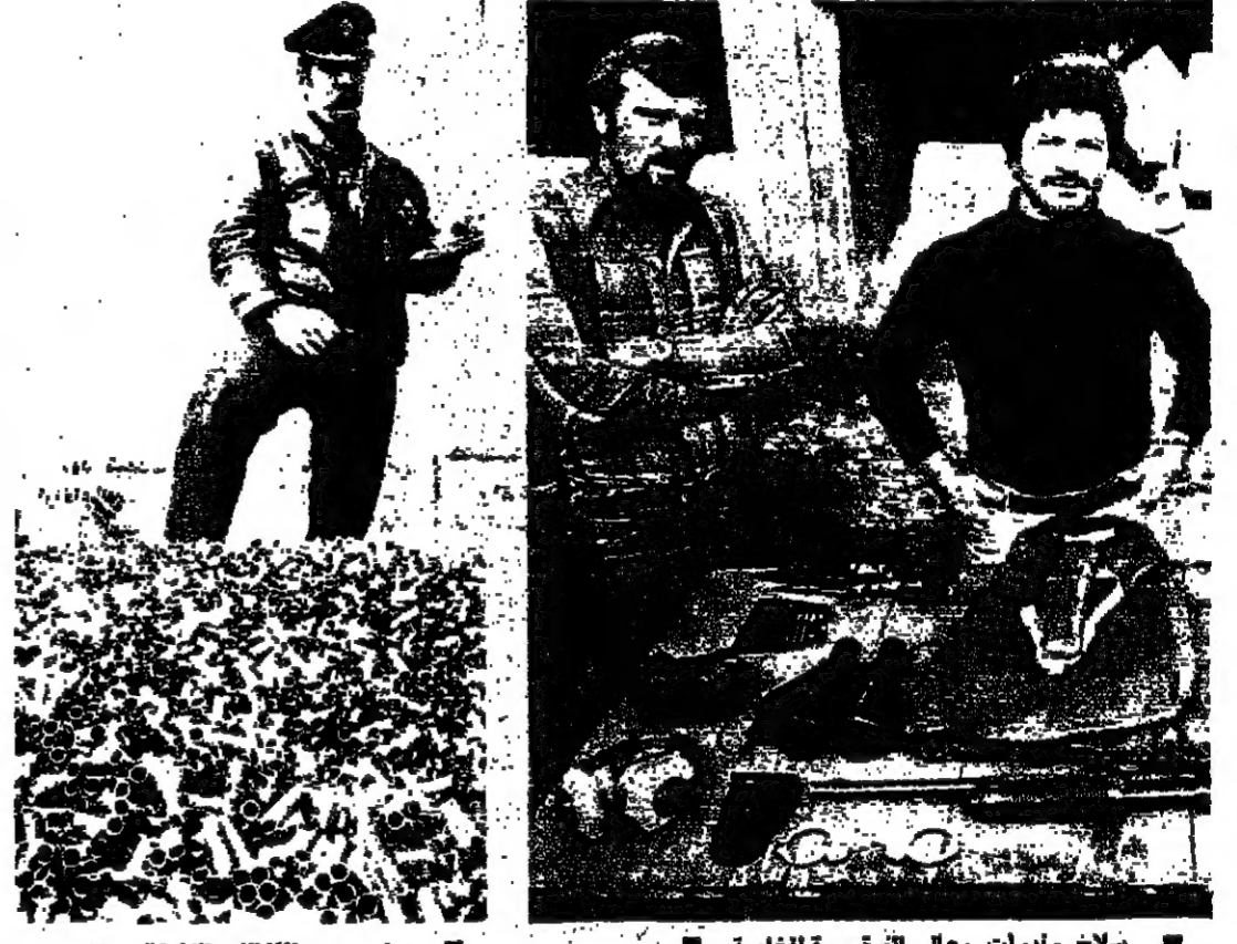
سلاح وادوات رجال الفرقة الخاصة